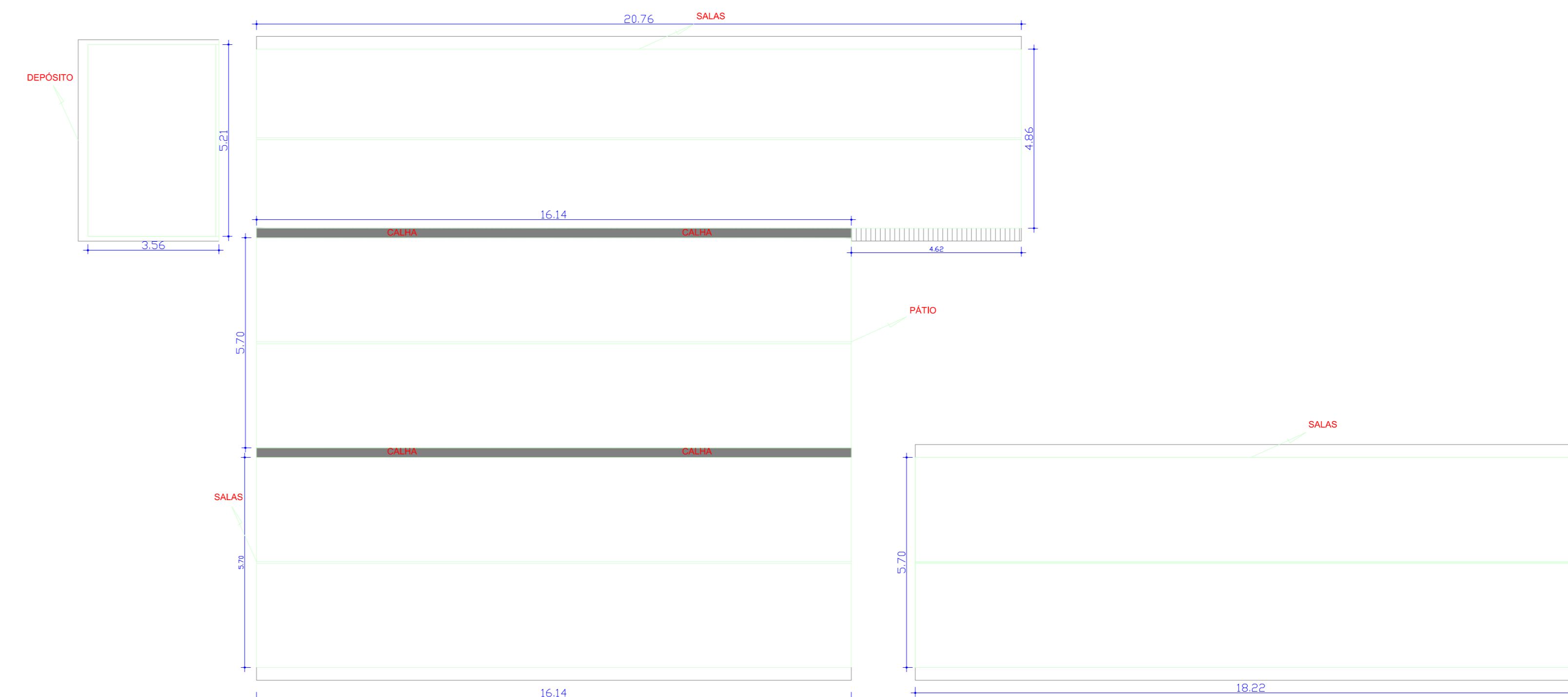
Escola Tancredo de Almeida Neves - PA PROVIDÊNCIA 1 : 100