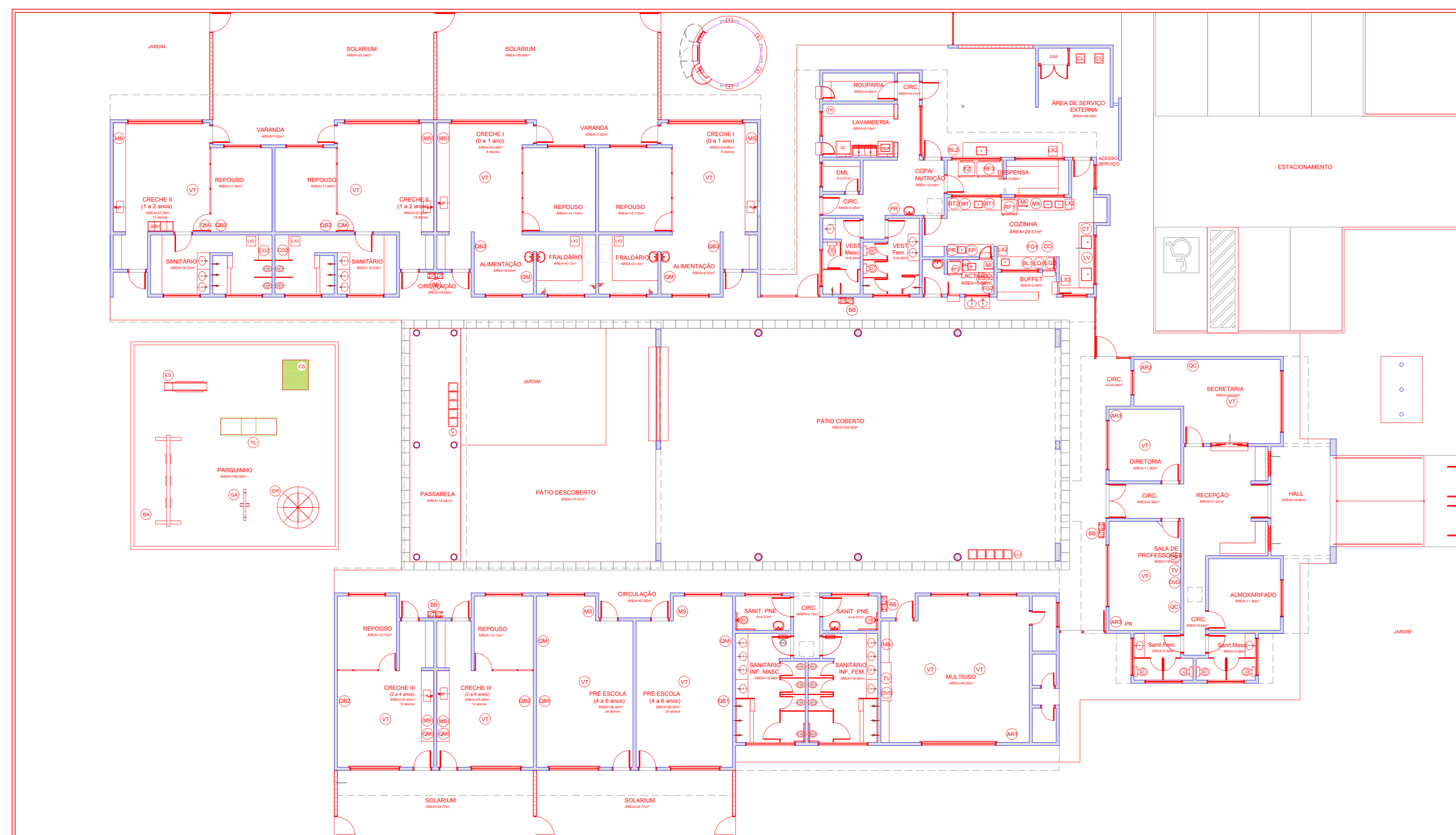
Creche Valteir Rodrigues - BERNARDO SAYÃO 1 : 100