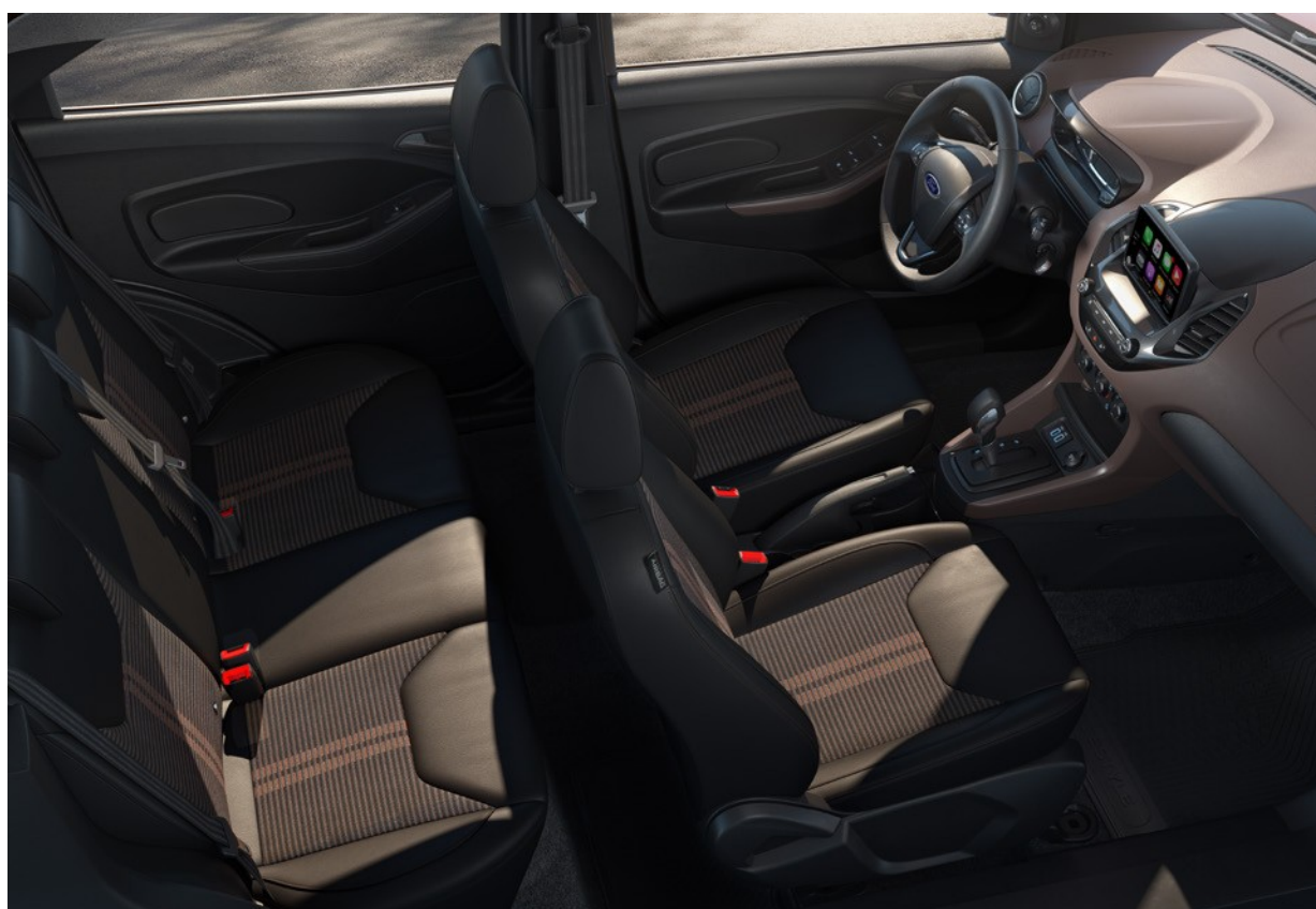
Interior Ka FreeStyle