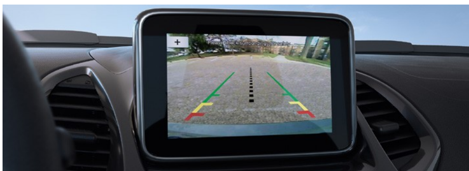
Câmera de ré